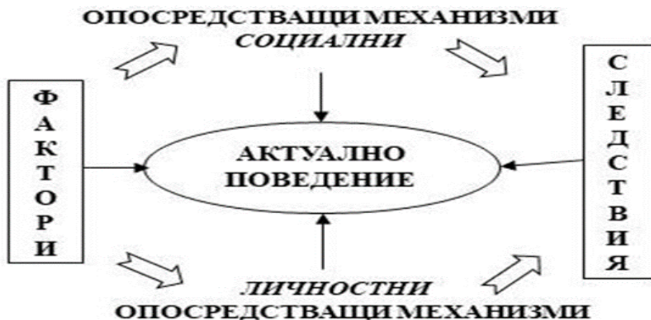
Фигура 2. Фактори и механизми на толерантното/нетолерантното поведение

Обобщеният преглед на литературата ни дава основание да изведем следните основни фактори и предпоставки, стоящи в основата на толерантното поведение (фиг. 2):