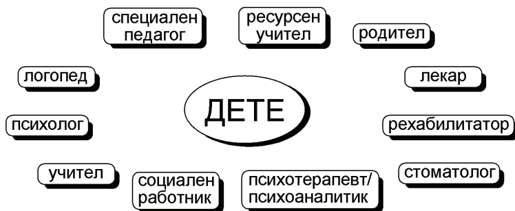
Схема 1. Мултидисциплинарен екип

Работата с дете със СП и неговото семейство следва да се реализира в екип, който включва ресурсен учител, класен ръководител, логопед, психолог и родител (схема 1).