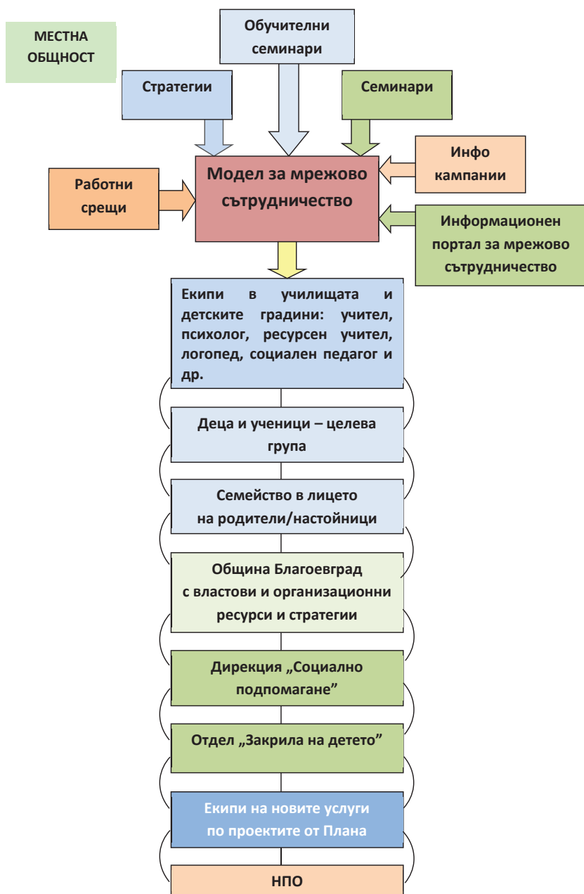
Схема № 2. Модел за мрежово сътрудничество