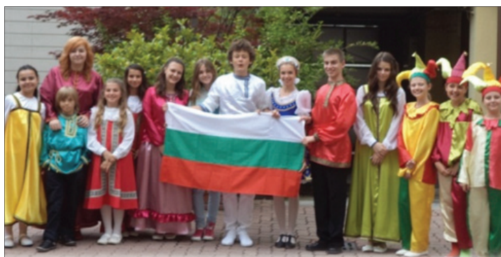
„Надо же умнеть помаленьку“, гр. Торино, Италия