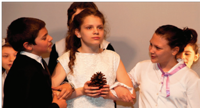
„Корзина с еловыми шишками“, К. Паустовский, гр. Торино, Италия