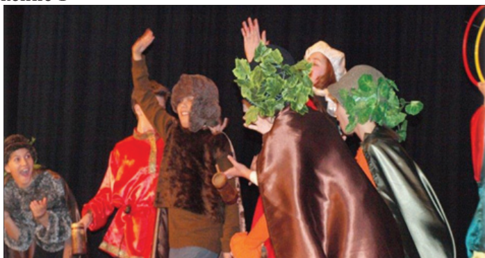
„Как медведь трубку нашёл“, С. Михалков, гр. Билгорай, Польша