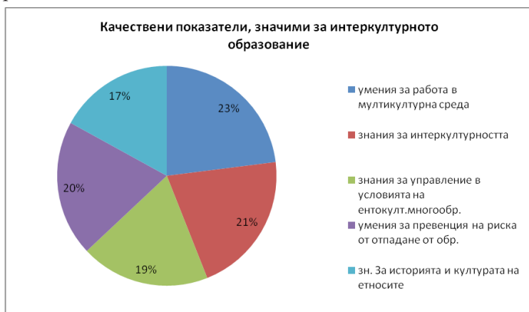
Фигура 1. Значими аспекти на становището на обучените педагогически специалисти относно качествените показатели, значими в план – интеркултурно образование

Становището на обучените педагогически специалисти относно качествените показатели, значими в план – интеркултурно образование, е представено във фигура 1.