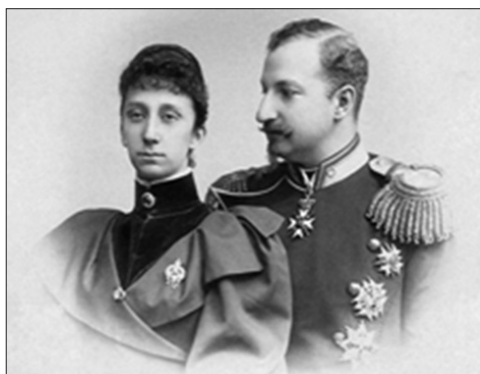
Княз Фердинанд и княгиня Мария-Луиза

След принудителния отказ на Батенберг от престола въпросът за Сандрово отново е поставен пред общинските власти, които след избирането на новия княз Фердинанд I му предоставят двореца за лятна резиденция. На 17. 07. 1893 г. по идея на своята годеница Мария-Луиза княз Фердинанд преименува наричания дотогава дворец „Сандрово“ на Евксиноград. Името е измислено да се състои от две части – „Понтос евксинокс“ (или Евксейност Понтос – древногръцкото наименование на Черно море) и българската дума „град“ – в превод „град на гостоприемното море“. На 27. 08. 1893 г. князът пише до председателя на Министерския съвет следното: