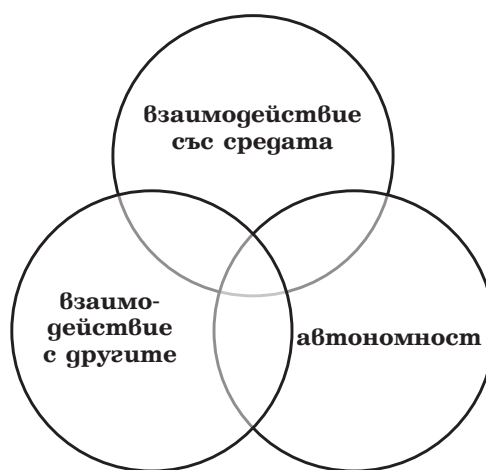
Фигура 1. Концептуална рамка на ключовите компетентности (OECD, 2005)

Защо ключовите компетентности са необходими за успешен живот? Те са не просто съвкупност от определени знания и умения, но и психосоциални ресурси – нагласи, отношения, които могат да бъдат използвани в определен контекст. Съгласно концептуалната рамка на ключовите компетентности хората трябва да разполагат с три групи ключови компетентности – фиг. 1.