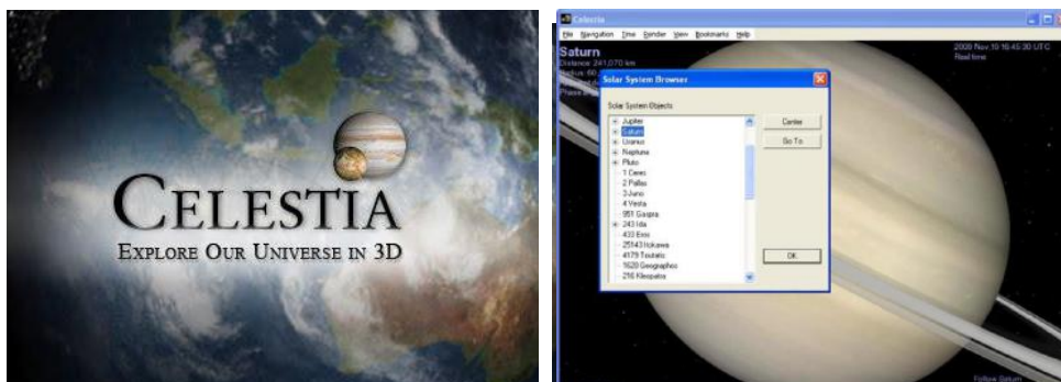
Фигура 3. Компютърн планетариум Celestia

Solar system scope е друг популярен компютърн планетариум. Той е изключително добре визуализиран. Разполага с база данни и 3D визуализации на Слънчевата система. Добре са представени орбитите на планетите. Има възможност да се проследи тяхното движение около Слънцето за различен период от време. Това е интересно за по-малките ученици поради добрите анимации. Предимството на този софтуер е, че може да се инсталира и на български език.