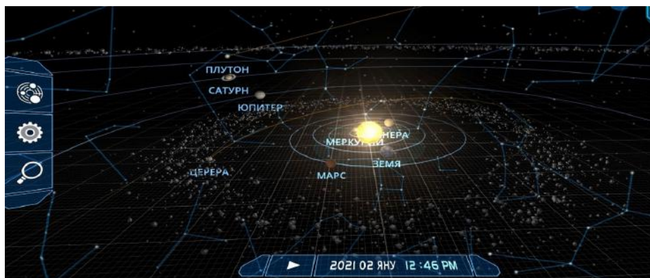
Фигура 4. Компютърн планетариум Solar system scope

Solar system scope е друг популярен компютърн планетариум. Той е изключително добре визуализиран. Разполага с база данни и 3D визуализации на Слънчевата система. Добре са представени орбитите на планетите. Има възможност да се проследи тяхното движение около Слънцето за различен период от време. Това е интересно за по-малките ученици поради добрите анимации. Предимството на този софтуер е, че може да се инсталира и на български език.