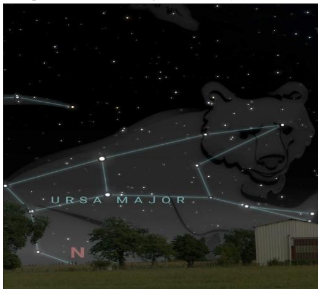
Фигура 1. Съзвездieto Голяма мечка