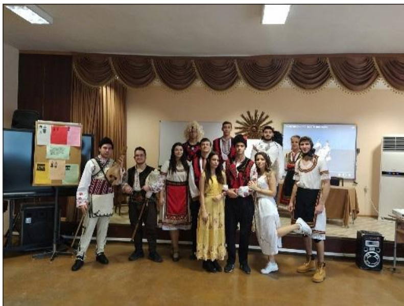
Изображение 1. Драматизация „На оня свят“

Представям ви нашия опит да разчупим начина за запознаване с разказа на Йордан Йовков „Серафим“. Идеята за драматизация на произведението бе на учениците от XII д клас в ПГЕЕ. Подготовката започна още през февруари 2020 г., като учениците, след анализ на съдържанието на текста, дадоха предложения за изработване на сценарий. Обсъдиха ролите и посочиха за изпълнители свои съученици, които отговарят на техните представи за героите. През март 2020 г. се наложи преминаването в дистанционна форма на обучение, но това не разколеба решението им да поставят своята театрална постановка.