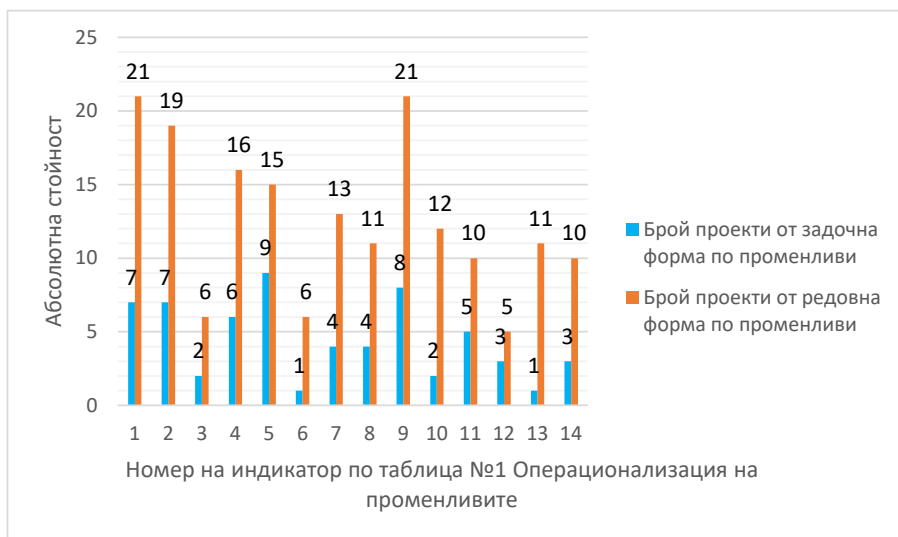
Фигура 2. Абсолютни стойности, разпределени по форма на обучение

Както се вижда от фигура 3, общите тенденции в абсолютните стойности по променливите се следват и в двете форми на обучение.