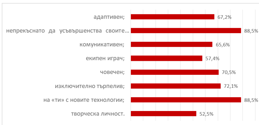
Фигура 1. Какъв трябва да бъде съвременният учител?

Добрият учител дарява децата със способността да опознават света и да се развиват. Учи ги да възприемат, обработват и прилагат получената информация. Това обаче може да постигне само учител, който притежава следните качества: любов към децата и към професията, търпение, чувство за справедливост, интелигентност. Сред професионалните качества, които са задължителни за съвременния педагог, студентите открояват „комуникативност и способност да намери подход към всеки ученик“ (фиг. 2).