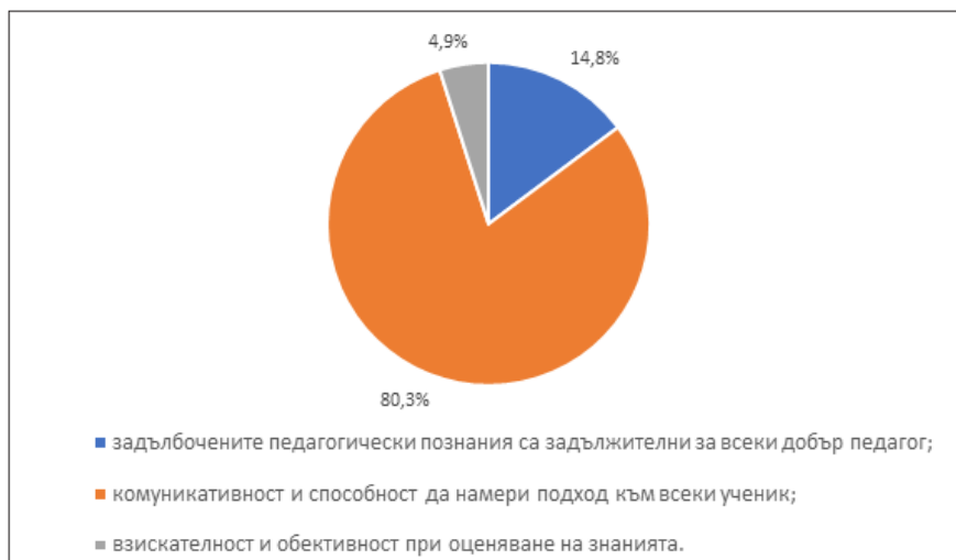
Фигура 2. Какви професионални качества трябва да притежава съвременният учител?

Добрият учител дарява децата със способността да опознават света и да се развиват. Учи ги да възприемат, обработват и прилагат получената информация. Това обаче може да постигне само учител, който притежава следните качества: любов към децата и към професията, търпение, чувство за справедливост, интелигентност. Сред професионалните качества, които са задължителни за съвременния педагог, студентите открояват „комуникативност и способност да намери подход към всеки ученик“ (фиг. 2).