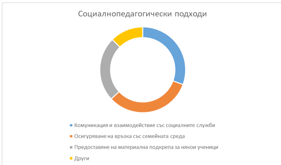
Фигура 2. Социалнопедагогически подходи, които затрудняват в настоящия момент помагачите специалисти в училищна среда

за, свързана с използването на училищно базираните стратегии по Вебер (Webber 2018). Но са индикирани и някои допълнителни полета, с които работещите към момента помагачи специалисти срещат непреодолими затруднения. При анкетното проучване се диспозиционират три сериозни подхода, които не могат да се реализират в пълна степен към настоящия момент (фиг. 2).