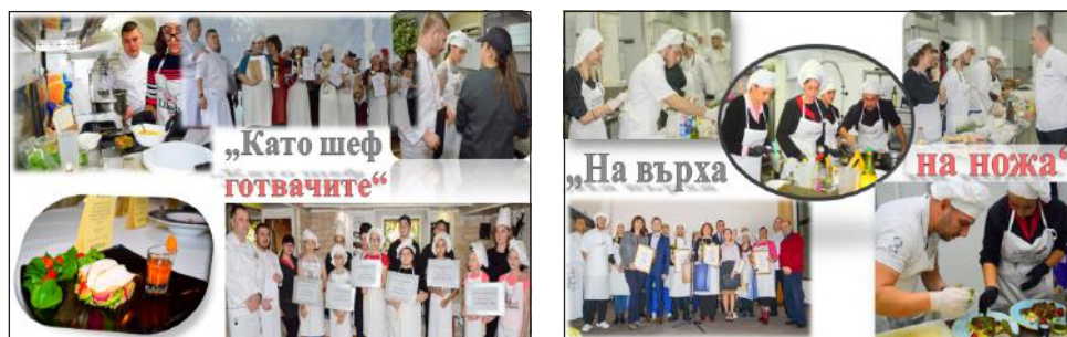
Фигура 3. Регионални състезания по професии – „Като шеф готвачите“ и „На върха на ножа“

Първото регионално кулинарно състезание за непрофесионалисти „ На върха на ножа “ се организира в Русе през 2017 г. Важният момент на този вид надпревара е участниците да се впуснат в „морето“ на кулинарното изкуство, като приготвят двустепенно меню по избор, но с един основен продукт, който всяка година е различен вид риба – заради местоположението на Русе на р. Дунав. В престилките „влизат“ ученици от гимназията и различни граждани, бизнесмени и управители. Учениците са отново подтикващите лица, които да съветват своите съотборници, за да достигнат до върха.