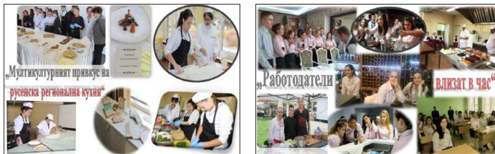
Фигура 4. Участие в проектна дейност с ученици от национален и международен характер

обединяващата роля на Европейския съюз. Всеки по свой начин е представил виждането си по темата, затова и експонатите са толкова различни.