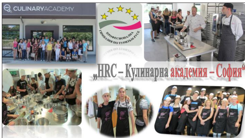
Фигура 6. Ден на отворените врати на „HRC – Кулинарна академия“ – София

в програмите на Академията, за да получат качествено международно образование в София и в чужбина. Професионално учениците се интересуваха от съвременното оборудване на кухните. Всички ученици, посетили Кулинарната академия HRC, останаха признателни към ръководството на ПГ по туризъм – Русе, и към ръководителите си за възможността да се доближат до изкуството на кулинарията.