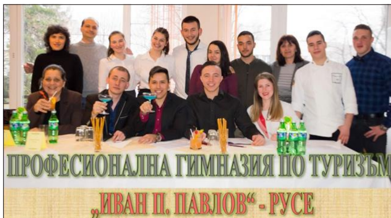
Фигура 10. Поздравления от екипа и учениците на Професионална гимназия по туризъм – Русе