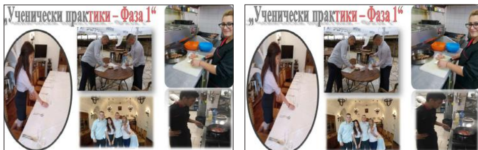
Фигура 8. Проект „Подкрепа за успех“, „Занимания по интереси“ и „Ученически практики“

Проектът „Ученически практики – Фаза 1“ ще допринесе за постигането на специфичните цели към нуждите на пазара на труда. Участващите ученици в проекта трябва да отработят определен брой часове при избран от тях работодател. В края на тази практическа дейност учениците получават трудово възнаграждение, което ги стимулира да продължат своето развитие в сферата, която са завършили.