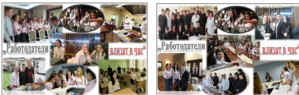
Фигура 5. Моменти от участието в проекта „Работодатели влизат в час“