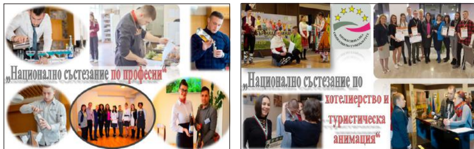
Фигура 1. Избрани моменти от Националното състезание по професии

Национално състезание по професии. Това състезание отваря най-много врати за бъдещото кариерно ориентиране, както и за развитие в избраната професия. Надпреварата се провежда ежегодно през месеците февруари, март и април. В него се включват пет категории: „ Най-добър млад готвач “, „ Най-добър млад сервитьор-сомелиер “, „ Най-добър млад барман “, „ Най-добър млад хлебар-сладкар “, „ Най-добър млад хотелиер “ и „ Най-добра туристическа анимация “. Състезанията включват три кръга – общински, областен и национален. Във всяка категория има определен регламент, който ежегодно се актуализира с настъпващите съвременни идеи, за да може участниците да бъдат все по-креативни в изработването на предложения продукт на пазара на труда.