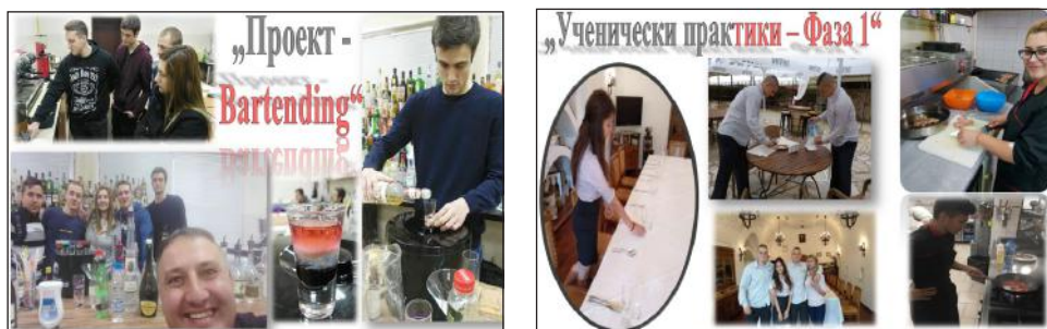
Фигура 7. Проект Bartending и Sommilabour, 2018 г.

Проектът „Подкрепа за успех“ е за подкрепа на учениците, които имат затруднения с усвояване на учебното съдържание по различни предмети. Основната цел е да се подпомогне за преодоляване на затрудненията в обучението и допуснатите пропуски при усвояване на новото учебно съдържание, за развитие на потенциала и възможностите им за успешно завършване на средно образование и за бъдеща социална, професионална и личностна реализация.