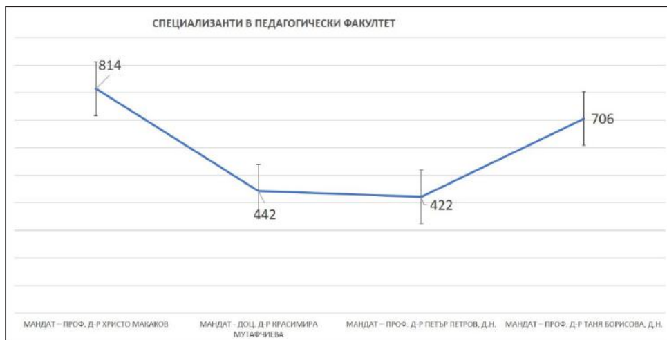
Фигура 3. Динамика на броя специализанти