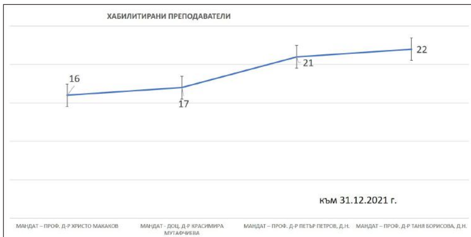
Фигура 4. Динамика на броя на хабилитираните преподаватели

Като административна дейност в ПФ за 20 години са проведени 20 общи събрания; близо 240 заседания на Факултетния съвет; взети са над 2000 решения във връзка с учебната, научноизследователската дейност, логистиката и следдипломното обучение, финансови въпроси. Ежеседмично се провеждат заседания на деканския и разширения декански съвети.