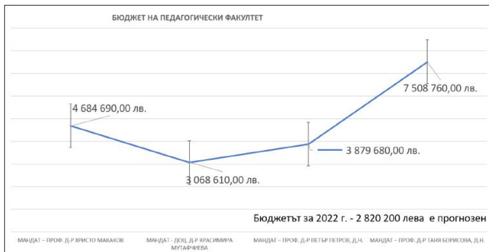
Фигура 5. Динамика на бюджета

Бюджетът на ПФ постепенно нараства на 1 773 070 лв.; 1 932 220 лв.; 2 047 460 лв., а за 2022 – 2 820 200 лв. (фигура 5). Въпреки оскъдното дър-