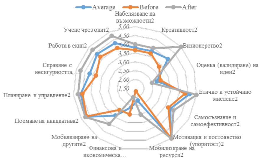
Фигура 2. Резултат на отговорите на секция В

– След провеждане на обучението, като цяло, се увеличава полезността по почти всички предприемачески компетентности, като най-съществена е промяната на важността (полезността) на визионерството, работата в екип, поемането на инициатива . В обратна посока е намаляване степента на важност на финансовата и икономическата грамотност .