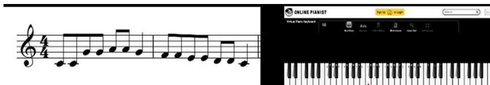
Фигура 1. Едногласна мелодия, която може да се изсвири на онлайн пиано

2. Озвучава се с помощта на дигитална клавиатура или други онлайн инструменти, като online piano, chrome music lab и др. Това е от особено значение за самоподготовката по предмета музика на студентите – бъдещи педагози, които нямат умения за свирене на акустично пиано или друг мелодичен музикален инструмент.