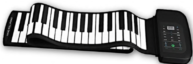
Фигура 2. Гъвкава силиконова клавиатура

3. Изсвирва се на гъвкава силиконова клавиатура, която позволява и хармонизиране на мелодията. Позитивите от използването на такъв тип клавиатура са, че тя е лесно преносима, подходяща както за онагледяване на музикални примери, така и за разпяване, звукови демонстрации и т.н. в учебни зали, в които липсва специфично музикално оборудване – например по време на лекция.