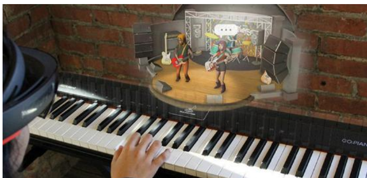
Фигура 4. Приложението с добавена реалност Music Everywhere

реалност, които имат различна функционалност, като най-разпространени са тези, подпомагащи изучаването на музикален инструмент, но също така музикална грамотност, теория на музиката, музикални стилове и т.н. Пример за това е приложението Music Everywhere, което спомага за изучаването на музикален инструмент по интересен и информативен начин.