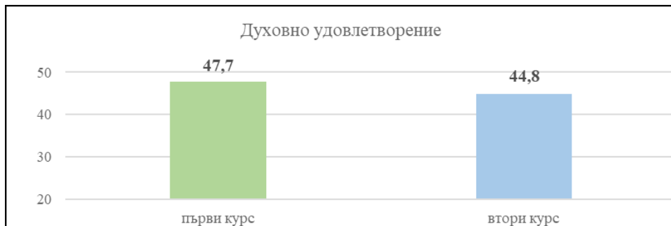
Фигура 1. Значими различия в средните стойности по духовно удовлетворение при първокурсници и второкурсници

дентите специалност. Диференциращ статистически ефект обаче има годината на обучение върху духовното удовлетворение ( t_{(131,21)} = 2,76, p = 0,007 ) като част от нравствено-деловата група ценности. Оказва се, че студентите първокурсници придават по-голямо значение на духовното си развитие като ценност ( X = 47,7; SD = 5,37 ), отколкото това правят студентите второкурсници ( X = 44,8; SD = 7,39 ) (вж. фиг. 1).