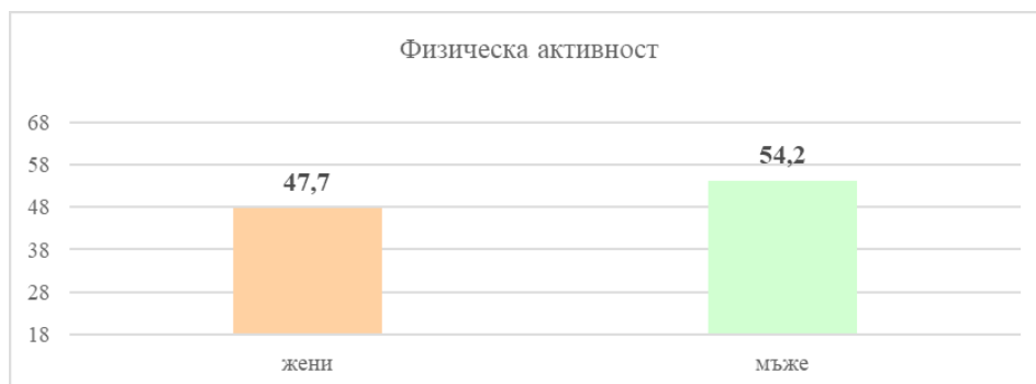
Фигура 4. Полови различия в средните стойности по физическа активност

Допуска се, че неравностойната изследвана съвкупност по полов признак (144 от женски и 10 от мъжки пол) е повлияла на факта, че не се установяват други значими различия между изследваните студенти от двата пола.