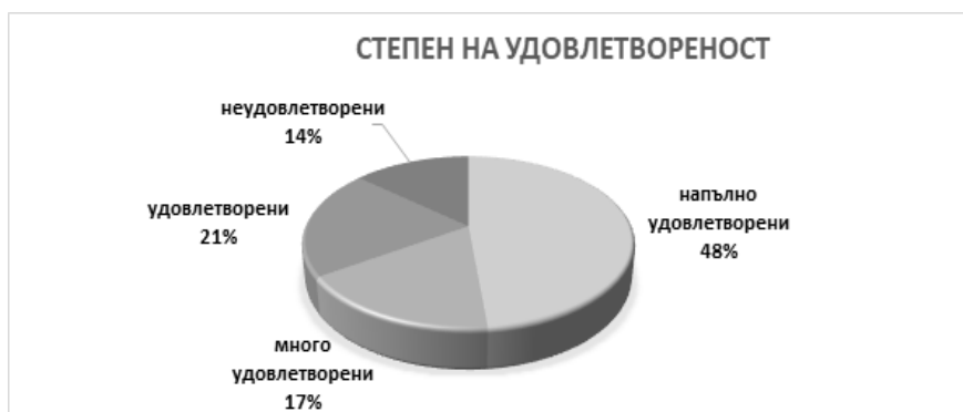
Фигура 1. Процентно разпределение на резултатите на въпрос „Доколко удовлетворителни бяха възможностите за избор на институция за провеждането на преддипломната практика?“

При представяне на данните прави впечатление, че 48% от анкетираните студенти напълно свързват натрупаните през годините на обучение теоретични знания с практическото реализиране. Никой от респондентите не е отговорил с възможността „Трудно ми е да преценя“, което показва, че завършващите студенти са напълно наясно, че натрупаните теоретични познания са важни при практическото им реализиране по време на тяхната преддипломна практика (фиг. 2).