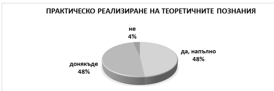
Фигура 2. Процентно разпределение на резултатите на въпрос „Свързахте ли натрупаните през годините следване теоретични познания с практическото реализиране по време на преддипломната практика?“

При представяне на данните прави впечатление, че 48% от анкетираните студенти напълно свързват натрупаните през годините на обучение теоретични знания с практическото реализиране. Никой от респондентите не е отговорил с възможността „Трудно ми е да преценя“, което показва, че завършващите студенти са напълно наясно, че натрупаните теоретични познания са важни при практическото им реализиране по време на тяхната преддипломна практика (фиг. 2).