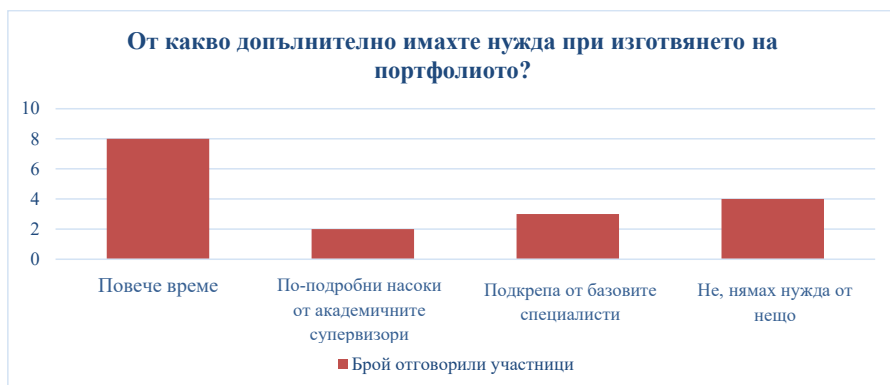
Фигура 3. Мнение на студентите относно допълнителна нужда при изготвяне на портфолиото (общо 17 студенти)

Както се вижда от графиката, половината от участниците в анкетното проучване споделят, че се нуждаят от повече време при изготвянето на портфолиото си.