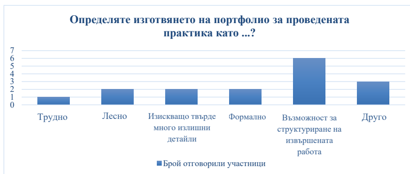
Фигура 2. Мнение на студентите при определяне изготвянето на портфолио за проведената стажантска преддипломна практика (общо 17 студенти)

рително зададените опции. В тези отговори се посочва, че студентите смятат изготвянето на портфолио за формално и изискващо твърде много излишни детайли. Както и че за тях е трудно да го изготвят и им е необходима възможност за структуриране на извършената работа. Други смятат, че е лесно, но с пояснение, че при трудност са имали подкрепата от базовия специалист и академичния наставник (фиг. 2).