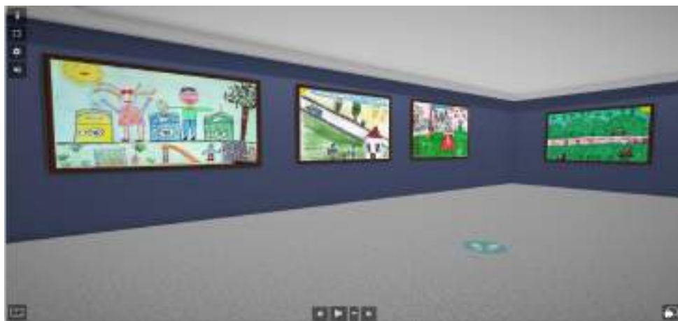
Фигура 2. Дизайн на изложбата

не и предлагат динамичен, интерактивен подход към обучението, което е съществен елемент на атосекундното образование. Творбите на учениците от началните класове в 140. СУ „Иван Богоров“, София (фиг. 2) са използвани като примери в изложбата. Ключов аспект на този метод е способността за предоставяне на незабавна обратна връзка (Gilmurray, Jonathan 2017). В контекста на виртуалната изложба (Artsteps), те имат възможност да получат бързи отговори за своите творби, което способства за личностното непрекъснато учене и усъвършенстване. Този непосредствен обмен на мнения подпомага развитието на умения за критично мислене и ефективно проблеморазрешаване (Alexandrache 2014; Al-Obaydi, Doncheva & Nashruddin 2021).