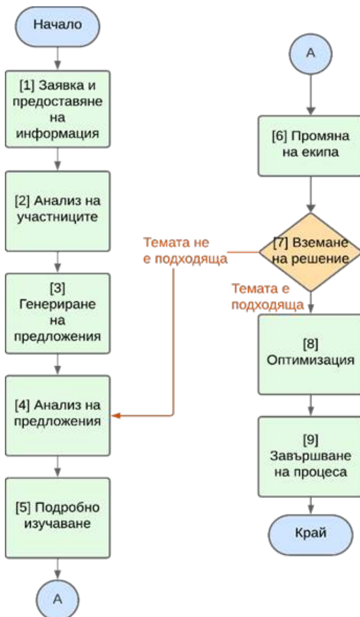
Фигура 2. Блок-схема на алгоритъм за избор на тема на НП