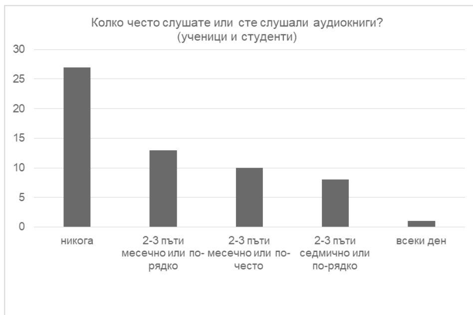
Фигура 2. Разпределение на данните по въпроса „Колко често слушате или сте слушали аудиокниги?“ (ученици и студенти)

Съпоставянето чрез линеен корелационен анализ на декларираната от учениците честота на слушане на аудиокниги с определените компоненти (твърдения 01 – 15) показва силна положителна свързаност (със стойност на корелационния коефициент по-голяма от +0.50) между: честотата на слушане и нагласата за слушане на аудиокниги при дефицит на време за четене на хартиен носител (твърдение 01); честотата на слушане и редовното слушане на аудиокниги (твърдение 06); честотата на слушането и преживяването при слушане на аудиокниги и при четене на хартиен носител (твърдение 14); честотата на слушане и успешната подготовка и справяне с изпити чрез аудиокниги (твърдение 15).