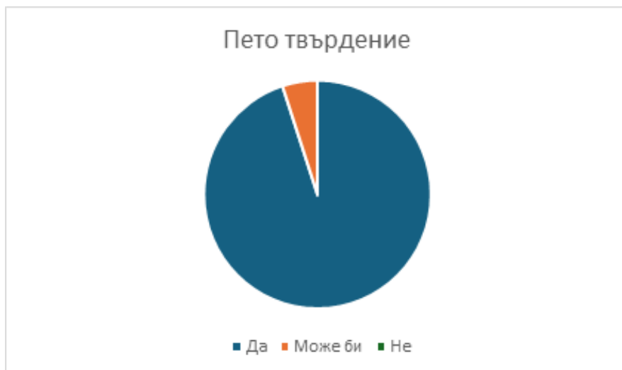
Графика 6. Резултати от пето твърдение – „Мисля, че е важно да се включвам в дейности, които помагат на другите“

отговорност се отразяват в резултатите, получени от това твърдение, като тези резултати определят доколко децата са приели предложената дейност като социална ценност.