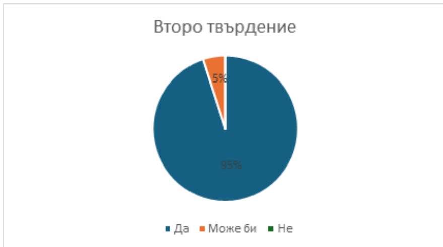
Графика 3. Резултати от второ твърдение – „Работата ми достави радост, защото знаех, че помагам“

Чрез това твърдение се измерват емоционалната награда, вътрешната удовлетвореност и реакцията от осъществения труд, положен на добра воля със съзнанието за помощ, известен като алтруистична радост или Helper's High.