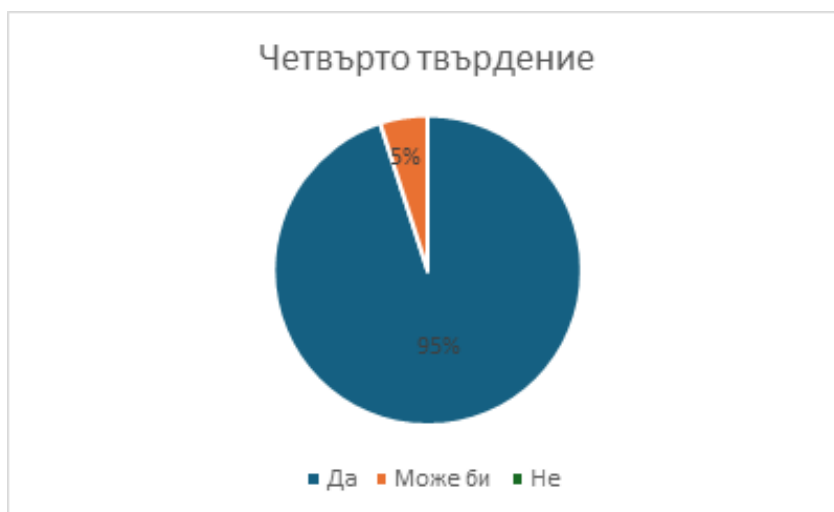
Графика 5. Резултати от четвърто твърдение – „Аз участвах активно в работата по писмената картичка“

Изключително високият процент на отговорили с „Да“ показва, че дейността съответства на потребността на 10-годишните да бъдат продуктивни. Усещането за активност, потвърдено от 95% от участниците, свидетелства, че преминаването от теоретично към практическо знание е подкрепено с чувството за полезност като резултат от дейността. Успешната организация на доброволческата дейност е позволила на почти всички деца да имат значима роля, предотвратявайки пасивността, която би довела до демотивация и чувство за незначителност. При това твърдение всички ученици с изключение на един участник са категорични, че са участвали активно, което означава, че предложената доброволческа дейност е оптимална по отношение на организация и изпълнение и осигурява условия за активно участие. Високата активност потвърждава резултатите от първо твърдение, което беше свързано с положителното чувство за значимост, и резултатите от второ твърдение, ориентирани към емоционална удовлетвореност от дейността.