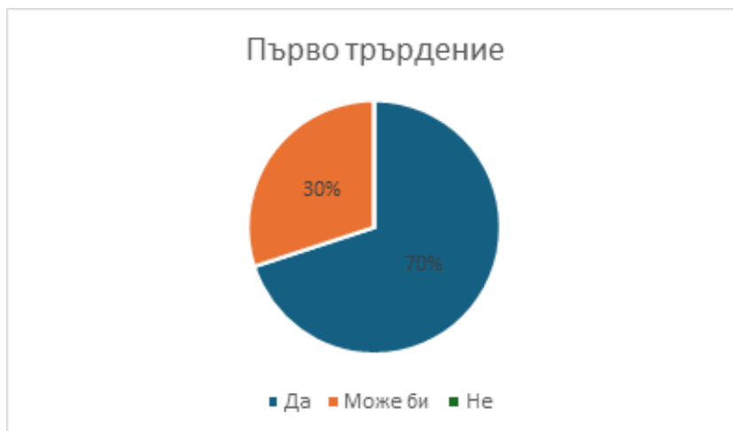
Графика 2. Резултати от първо твърдение – „Чувствах се важен/на, че взех участие в тази дейност“