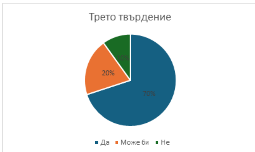
Графика 4. Резултати от трето твърдение – „Вярвам, че нашата писмена картичка ще донесе реална помощ“

Това твърдение измерва степента на убеденост в ефикасността на резултата от конкретната форма на помощ, която в случая е изработката на писмена картичка. Тук се разглежда когнитивният аспект на доброволчеството, а именно до каква степен анкетираните ученици са на мнение, че трудът им има практически смисъл. Това твърдение предоставя възможност за измерване на съответствието между логическото разбиране на учениците за смисъла на труда им и вътрешното емоционално удовлетворение, отразено в отговорите в трето твърдение.