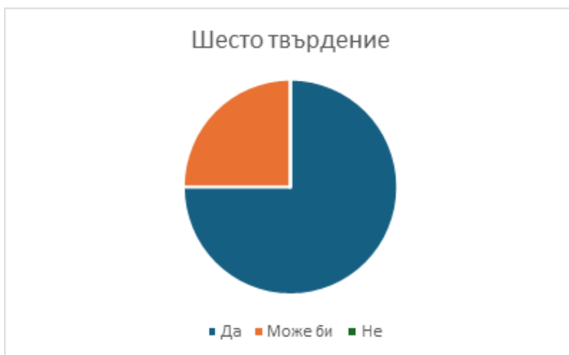
Графика 7. Резултати от шесто твърдение“ – „Искам да участвам в още дейности, които помагат на другите“

Отговорите към това твърдение отразяват бъдещата поведенческа нагласа и дългосрочна мотивация. Това е последният, но най-важен показател за устойчивостта и вероятността за повторно включване в доброволчески дейности. Чрез това твърдение се цели проследяване на трансформацията на позитивните емоции в ценности, изразяващи се в конкретно намерение за действие.