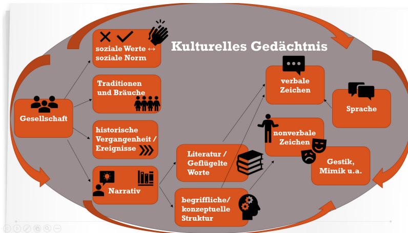
Schema 1. Kulturelles Gedächtnis

Nach Chakarova (2023) und Cherneva (2024) bezeichnet ein kulturelles Emblem ein Symbol oder Bild, das wichtige Aspekte einer Kultur sichtbar macht und weitervermittelt. In diesem Sinne „fungieren Symbole als verbindendes Fundament, das einer Auflösung einer Kultur in einzelne chronologische Schichten entgegenwirkt!“ (Chakarova, 2023, p. 123). Dazu zählen Zeichen und Darstellungen, die eine spezifische Bedeutung tragen und zur Identifikation mit einer Gemeinschaft oder Tradition beitragen. „Semiotische Untersuchungen demonstrieren die hohe Produktivität des Interesses an der Sprache räumlicher Kulturbeziehungen. Der Geist des Territoriums konstituiert dabei einen Boden, der Raum, Geschichte und Kultur verbindet und folglich Wertbedeutungen, Orientierungen und Begrenzungen formt“ (Kuzova, 2018, p. 233).