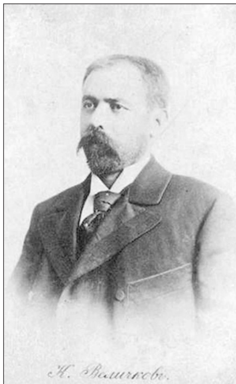
Константин Величков (1855 – 1907)